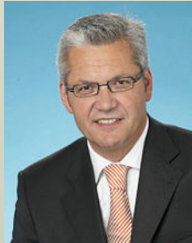
Hubert Hüppe MdB