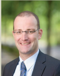
Jens Spahn MdB