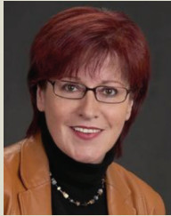
Ingrid Fischbach MdB Parl. Staatssekretärin