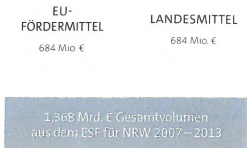
Abb. 23: Höhe und Aufteilung der ESF-Förderung 2007–2013 in NRW

Für Nordrhein-Westfalen standen im Betrachtungszeitraum insgesamt 684 Millionen € aus dem Europäischen Sozialfonds zur Verfügung. Weitere 684 Millionen € an Landesmitteln wurden zur Kofinanzierung bereitgestellt. Somit betrug das Gesamtvolumen in der Förderperiode 2007 bis 2013 für ganz Nordrhein-Westfalen rund 1,368 Milliarden €.